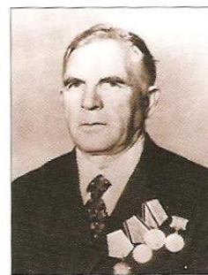
В.П. Губарев (1914–1994)