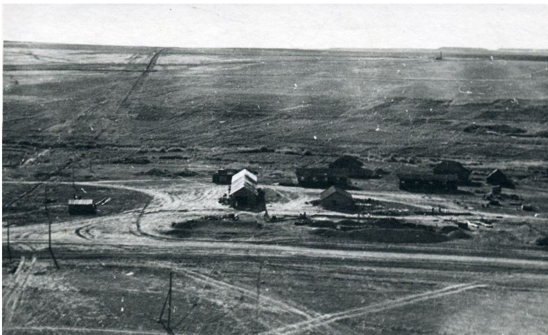
Рис 1. Елшанский газовый промысел 1940-50-е года.

Так близ села Елшанка (рис. 1) было открыто первое в Саратовском Поволжье газовое месторождение, что стало поворотным событием в поиске и освоении газовых месторождений не только в Саратовской области, но и на всей территории Русской плиты [10].